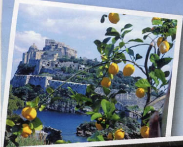
Capri (Napoli). La statua di Tiberio sul monte Solaro. Nei riquadri a lato, dall'alto, il castello Aragonese dell'isola di Ischia raggiungibile in breve tempo da Capri, la Grotta azzurra e la famosa Piazzetta.